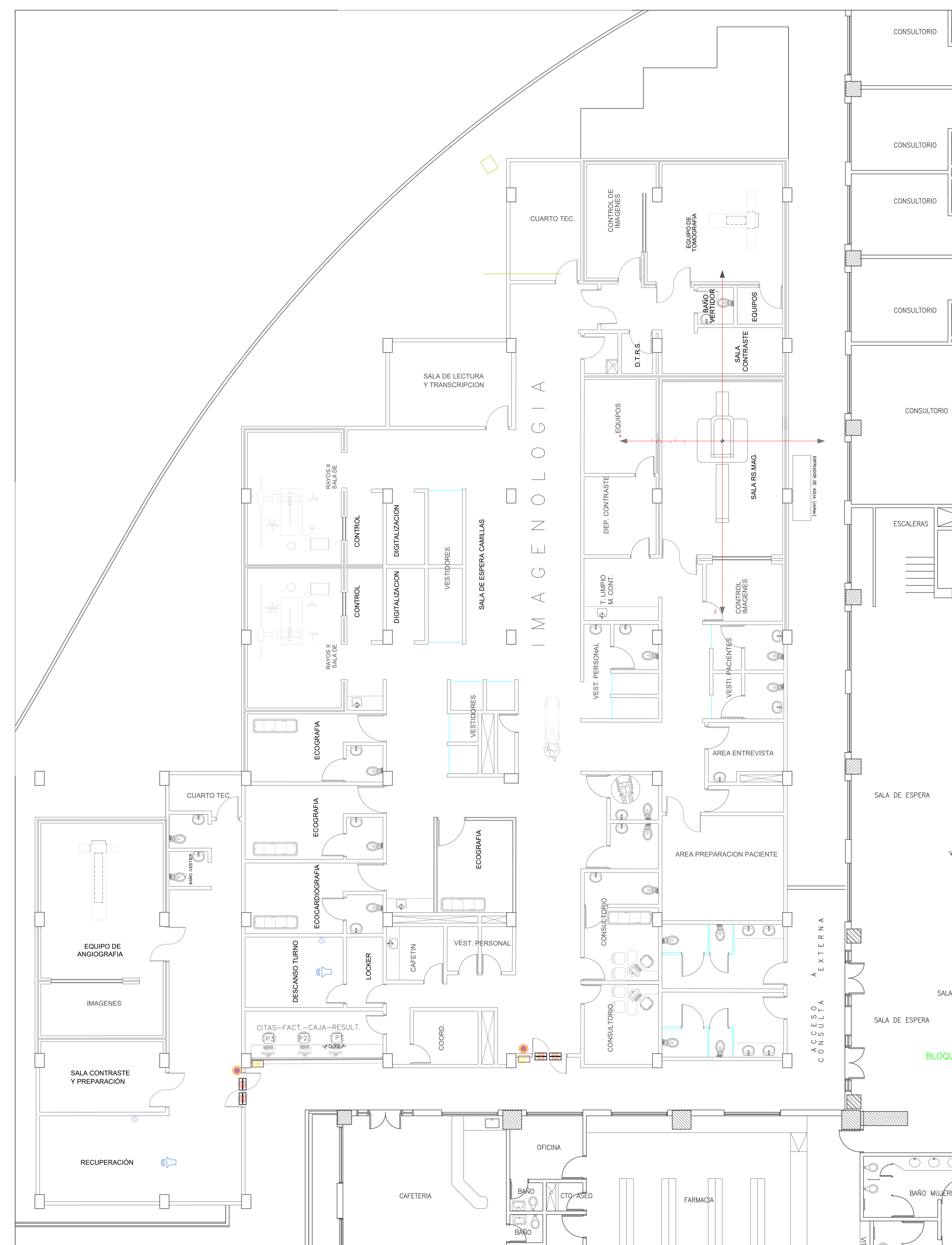
CONTROL ACCESO, SONIDO Y SALIDAS TV PISO1