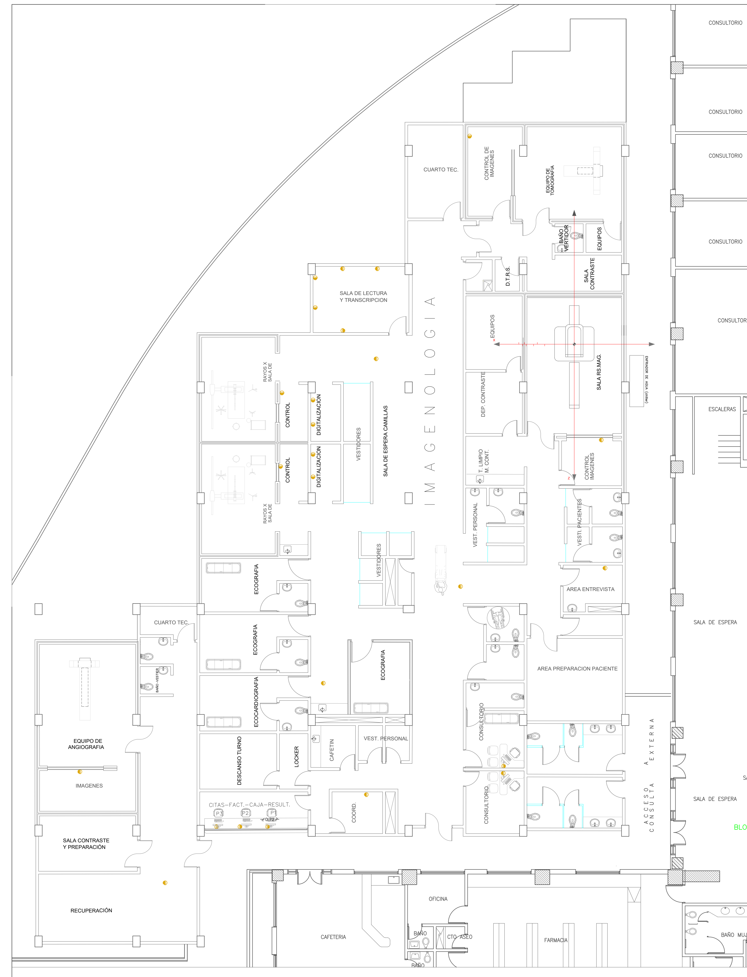
TOMACORRIENTES REGULADAS PISO1